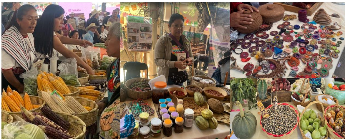
Figura 3. Diversificación de los productos de la milpa.

De esta forma se dinamiza la estructura familiar, pues en las pláticas con las productoras, expresaron que tanto hijos como hijas apoyan a labores de forma general e indistinta, aunque sólo las personas registradas reciben la capacitación, el trabajo se extiende a los miembros de la familia quienes participan como sistema de apoyo, incluso para colocar puestos durante la feria agroalimentaria (Figura 3), integrando la venta de productos alternativos para lograr un trabajo digno como lo señala (Naciones Unidas, 2025).